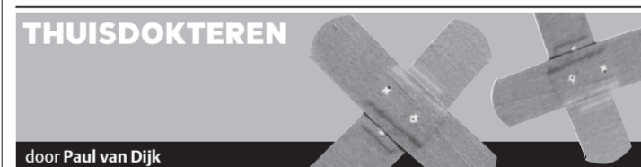
door Paul van Dijk